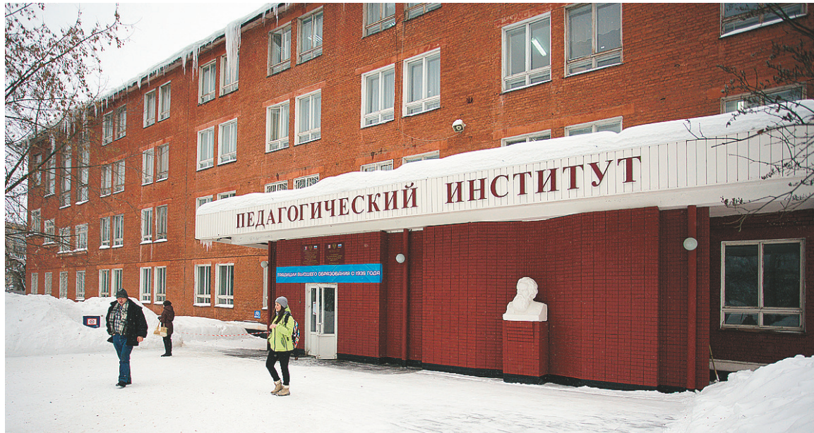
Глазовский институт многие годы является флагманом педагогического образования в республике.

На эту задачу работает все образовательное пространство, учебная и социальная инфраструктура.