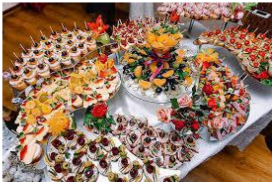
Прием по случаю открытия конференции (Фуршет) (15 октября 2021 г., 9:00-10:00)