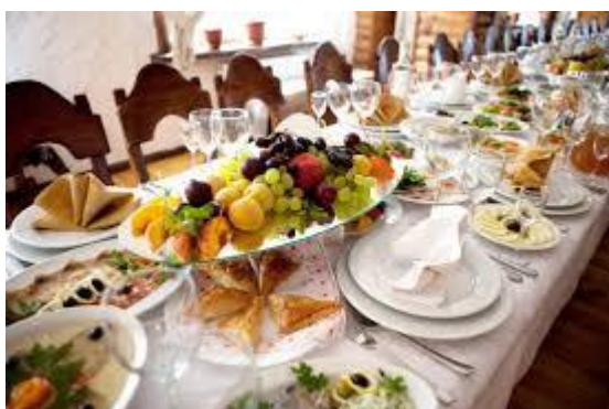
Банкет (15 октября 2021 года, 16:00.)