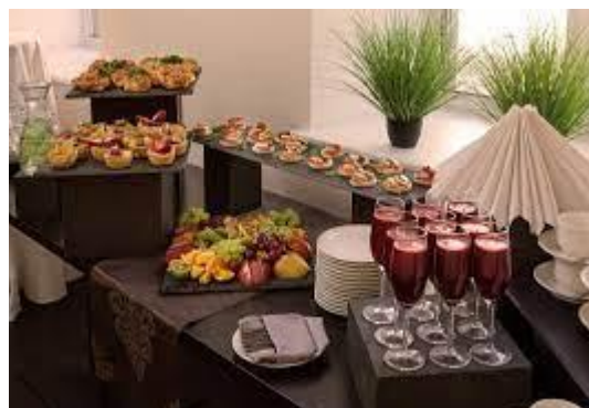
Кофе брейк (15 Октября 2021 года, 13: 00-14: 00)