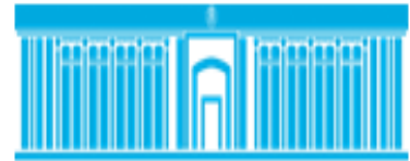
Ўзбекистон Республикаси Молия вазирлиги