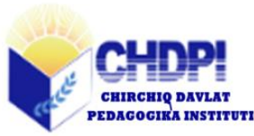
Тошкент вилояти Чирчиқ давлат педагогика институти