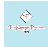
Хорижий тиллар кафедраси