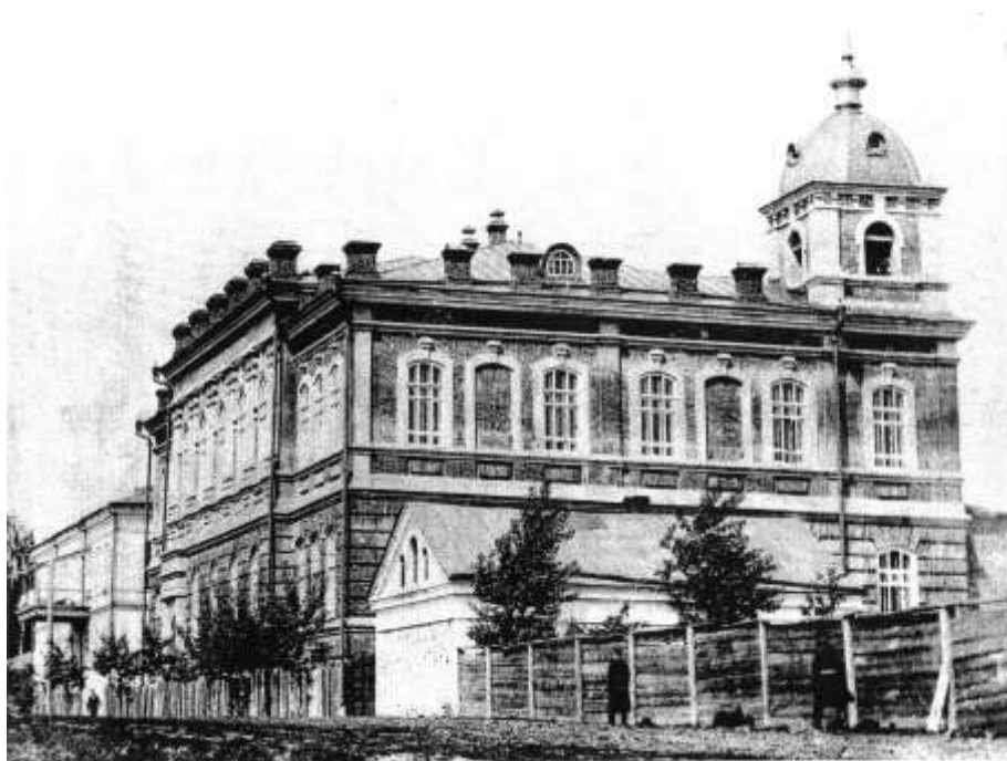
ЗДАНИЕ ДУХОВНОГО УЧИЛИЩА на углу Преображенской (Революции) и Кругло-Чепецкой (Карла Маркса) Глазов 1910-1914 гг.