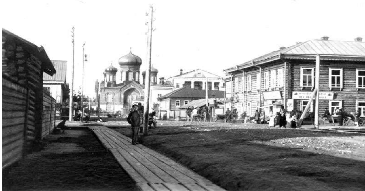
УЛИЦА ПРЕОБРАЖЕНСКАЯ. Глазов 1910-1914 гг.

23 января 1803 года был введен кодекс правил народного просвещения, 5 (17) ноября 1804 года – «Устав университетов Российской империи» и «Устав учебных заведений, подведомственным университетам». Согласно этим уставам народное просвещение делилось на 4 ступени: церковно-приходские училища, уездные училища, гимназии и университеты, которые давали соответственно начальное, неполное среднее, среднее и высшее образование.