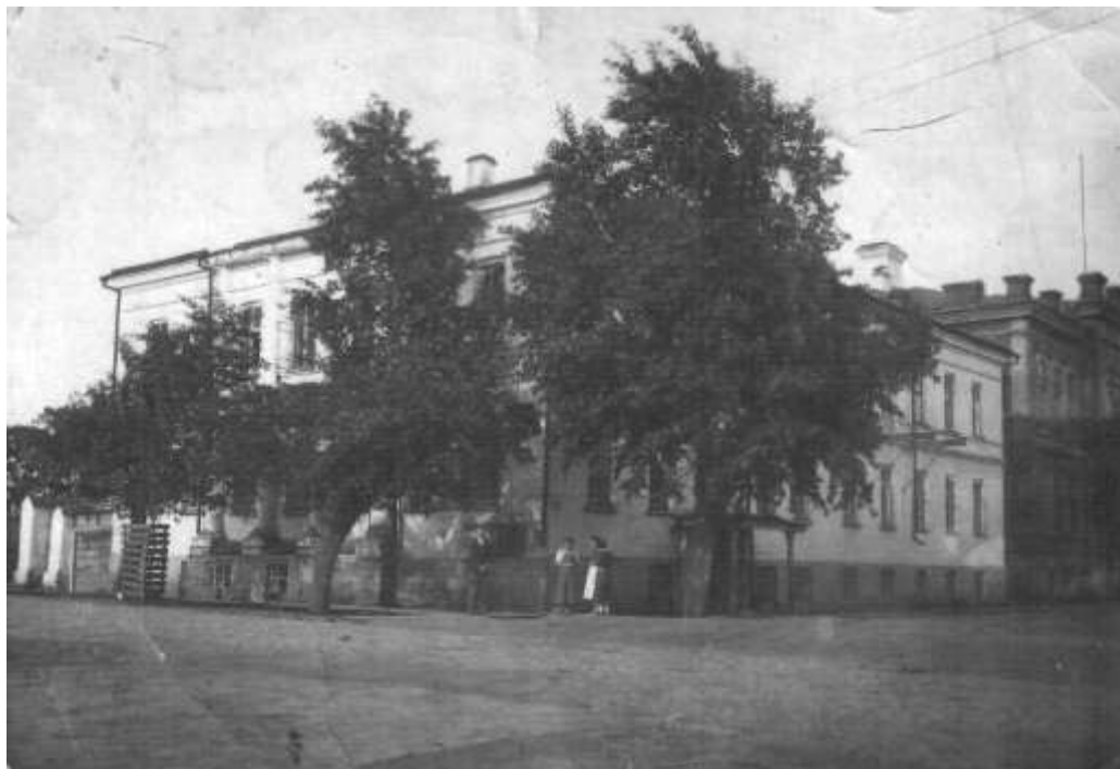
ЗДАНИЕ ГЛАЗОВСКОГО ПЕДАГОГИЧЕСКОГО УЧИЛИЩА

В 1939 году открывается Глазовский учительский институт. Постановлением Совета народных комиссаров УАССР от 11 марта 1940 года имущество Глазовского педучилища было передано учительскому институту.